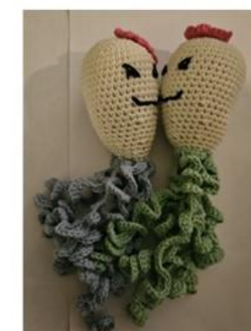
ambulancerne til at trøste et barn.

Vi strikker dåbsklude, og på et tidspunkt strikkede vi halstørklæder til hjemløse. Men som sagt er det op til hver enkelt, hvad man vil lave. Ingen tvang.